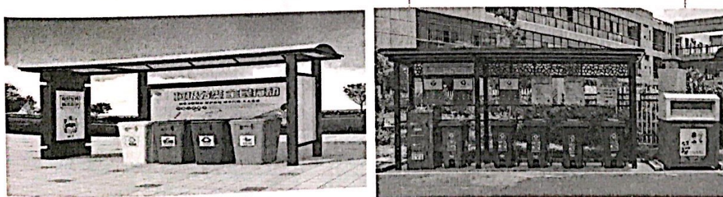
图 3 分类亭设计外观样图